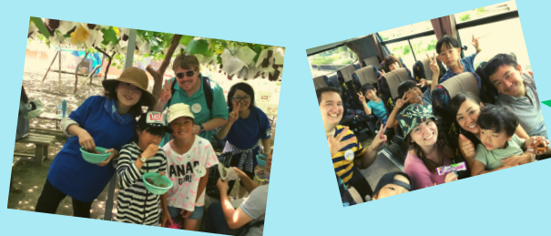
※写真は昨年のアニーサマーツアーの様子です

※注1 最少催行人員は各バス30名となります。添乗員は同行致しません。 ※注2 申込書にてお選びいただいた場所に当日はお集まりください。 ※注3 おこづかい、お弁当、おやつを各自ご準備いただき園内にも持ち込んでいただくことも可能です。